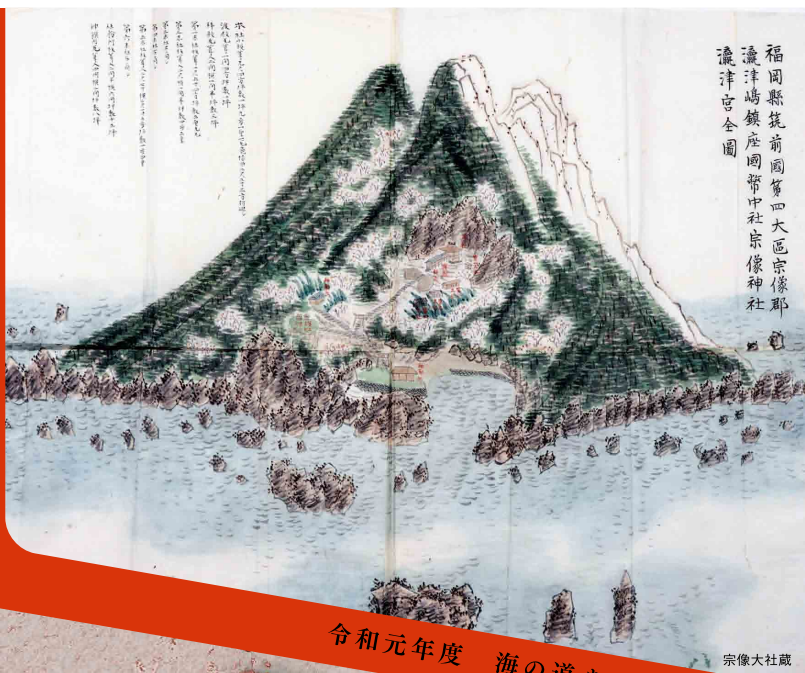
福岡縣筑前國第四大区宗像郡瀧津宮全圖